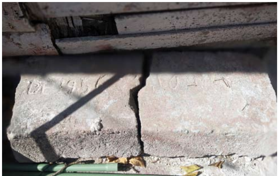
Casa construida en 1956 de acuerdo a la piedra grabada que aún conserva la familia.

juguets, entonces ella vivía sus tradiciones que eran mezcladas. Ese juguetero no es tan antiguo, lo consiguieron cuando estaba en su apogeo la Zona Libre, de acá vendían cosas muy bonitas las vajillas con acabados en color oro que todavía conservamos.