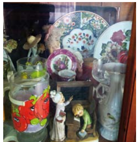
Las hermanas Ruiz Muñiz recuerdan: "Nuestra madre nos enseñó a conservar las cosas de mi abuelita, casi todas provienen de Belice y como colonia inglesa de allá venía la influencia arquitectónica, el tipo de muebles, adornos, juguetes, entonces ella vivía sus tradiciones que eran mezcladas"