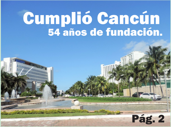
Cumplió Cancún 54 años de fundación.