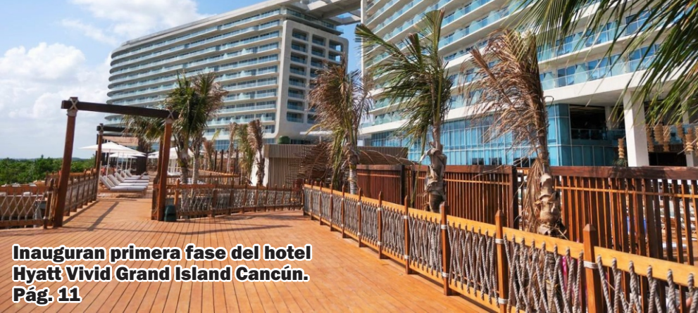
Inauguran primera fase del hotel Hyatt Vivid Grand Island Cancún. Pág. 11