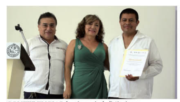
CONFERENCIAS de primer nivel, distinciones y capacitación fueron parte de este primer evento que concluyó con rotundo éxito.