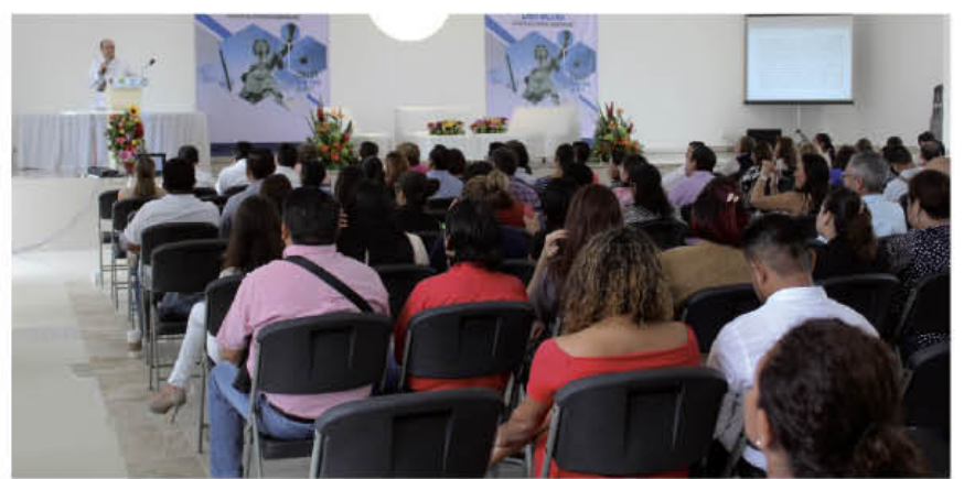
EN EL DESARROLLO de las ponencias y los paneles de discusión analizaron los retos del sistema democrático en general.