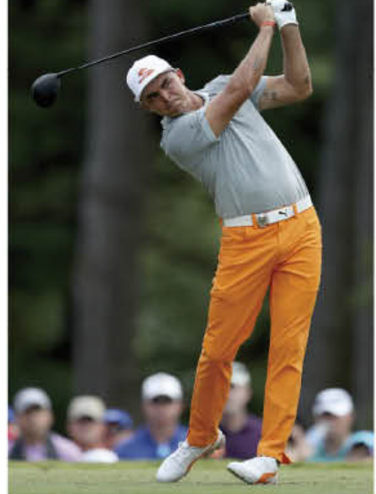
RICKIE FOWLER, número diez del mundo, tomará parte en el certamen por vez primera.

Como ya es tradición, niños de 17 años y menores, que estén acompañados de un adulto con boleto, entran gratis cortesía de Ciudad Mayakoba. Además, el OHL Classic at Mayakoba ofrecerá transportación gratuita saliendo de Cancún y Playa del Carmen al torneo y de regreso.