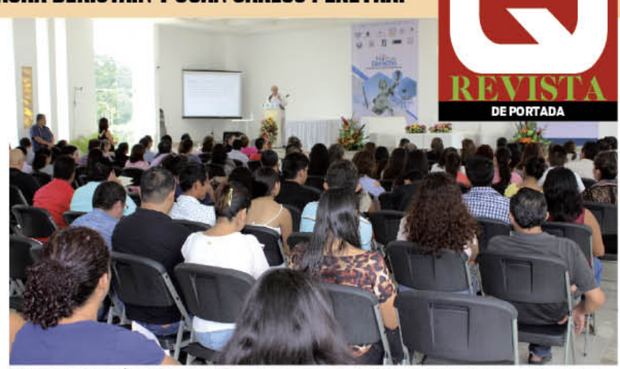
EL FORO JURÍDICO es histórico. La convocatoria fue amplia y diversa, en beneficio de todos los profesionales y futuros profesionistas.