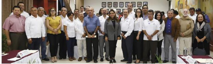
SE INSTALA el Consejo Consultivo de Desarrollo Urbano para el período constitucional 2018-2021.