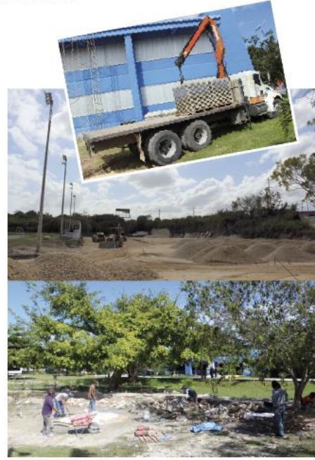
LAS OBRAS de infraestructura en pleno desarrollo deberán estar concluidas antes del 31 de marzo.

“Aquí todas y todos son bienvenidos, sobre todo ahora, cuando ofrecemos más y mejores oportunidades”, concluye.