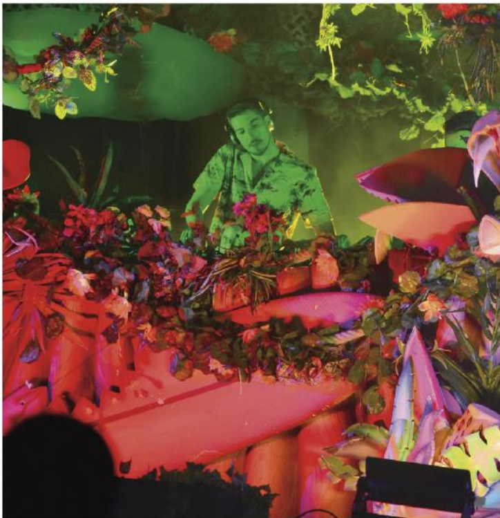
TÍESTO hizo vibrar a más de mil personas que se dieron cita en el Melody Maker.

PARA SUS PRIMEROS SEIS MESES, PRESENTARÁ "PARTY HOTEL", FIESTAS CON ARTISTAS DE TALLA INTERNACIONAL CUYAS ENTRADAS INCLUIRÁN BARRA LIBRE Y POOL PARTY.