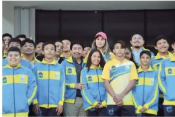
UNIFORMES de calidad.

una buena preparación y capacitación podemos lograr mejores resultados para el municipio”, resaltó.