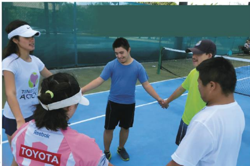
CADA CLASE ES EVALUADA con una bitácora y así medimos el avance. Información para las clases contactar a través de redes sociales o correo electrónico: tenisconamor.mx@gmail.com