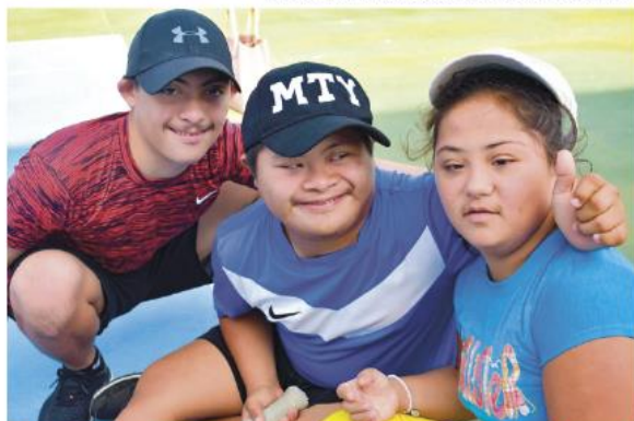
ALUMNOS DE cuatro años en adelante. Tienen entre 16 y 25 alumnos, de entre 6 y 10 años.