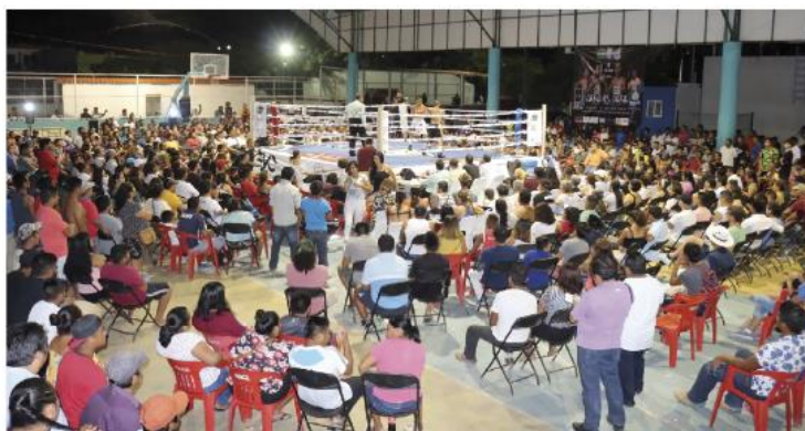
FUNCIONES de boxeo.

“El desarrollo del deporte no sólo se está en la cabecera municipal si no también en la Zona Maya como el caso de futbol en Akumal, Che-