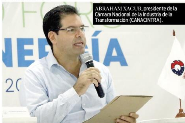
ABRAHAM XACUR, presidente de la Cámara Nacional de la Industria de la Transformación (CANACINTRA).

EN LA PENÍNSULA DE YUCATÁN, EL COSTO DE LA ELÉCTRICIDAD QUE PRODUCE LA CFE ES 22 POR CIENTO MÁS ALTA QUE EN EL CENTRO DEL PAÍS.