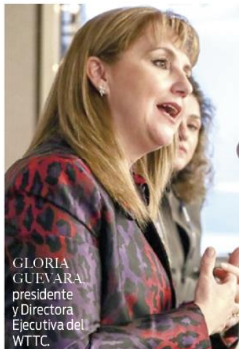
GLORIA GUEVARA, presidente y Directora Ejecutiva del WTTTC.

Cancún sigue siendo atractivo para la realización de grandes e importantes eventos detalla internacional, y prueba de ello es que el Consejo Mundial de Viajes y Turismo (WTTTC, por sus siglas en inglés), encargado de promover un crecimiento para el sector de viajes y turismo a nivel mundial, anunció que su Cumbre Mundial, edición 2020, se realizará en dicho centro vacacional, del 21 al 23 de abril próximos, y a finales de año se llevará a cabo un importante evento en San Juan de Puerto Rico, donde inicialmente había sido programada dicha reunión, pero que fue cancelada.