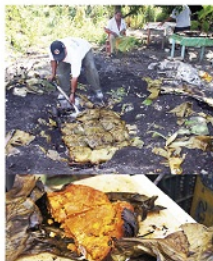
VALLADOLID es un lugar donde pueden descubrirse prácticas indígenas cotidianas, alejadas totalmente del folclorismo y de las "muestras" actorales montadas en los grandes centros turísticos.