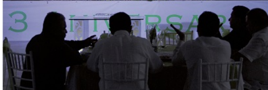
EL ESPECTÁCULO de Willy Wonka Show deleitó a los presentes.