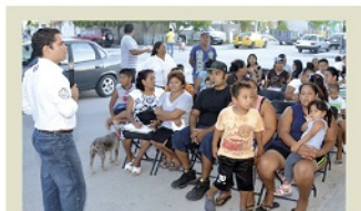
LA SOCIEDAD entera demanda más apertura para la participación ciudadana.