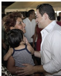
EN UN AMBIENTE ameno las familias conversaron con el legislador federal, a quien expresaron confianza.

“Mi responsabilidad es llevar a la Cámara de Diputados el sentir ciudadano y lo estamos haciendo aquí, trabajando de frente a ustedes y también a partir de la consulta ciudadana “Quintana Roo cuenta con todos”, que ha servido como un medio importantísimo para estar en constante contacto con lo que nuestra gente piensa y siente”, finalizó.