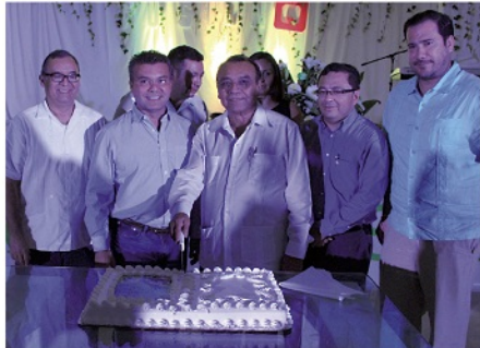
LA CELEBRACIÓN del tradicional corte del pastel.