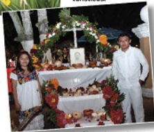
FAMILIAS enteras levantan un altar, con niveles diferentes, en el interior de la vivienda, la que servirá para honrar a sus muertos.