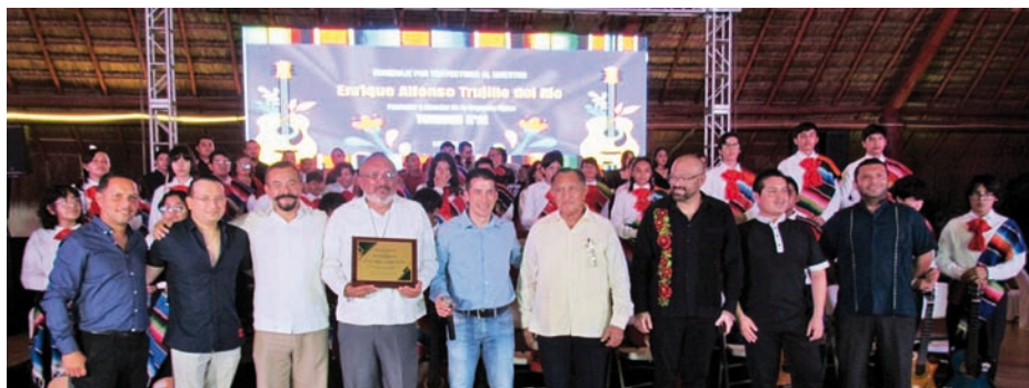
Alumnos que formaron parte de la Orquesta Típica Tumben K'ai, también fueron protagonistas de este magno evento.