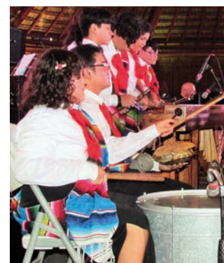
Chicos de la actual generación.

Alumnos, desde la primera generación hasta la última, que fueron parte de la Orquesta Típica Tumben K'ai, fueron protagonistas de este magno evento, haciendo honor a lo que su director musical les enseñó en su momento: amor al prójimo, perseverancia, solidaridad y compañerismo, valores que han llevado consigo desde que participaron en el Teatro de Bellas Artes de la Ciudad de México; en Toronto,