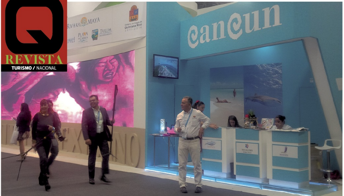
EL CARIBE demostró una vez por qué sigue siendo el rey en este sector.