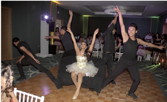
NÚMERO musical de Burlesque con chambelanes.