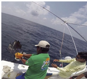
IMAGEN DE LA LIBERACIÓN DEL PEZ VELA en el III Torneo Internacional de Pesca Deportiva "Copa Capitán Ferrat".

tana Roo, mencionó "yo quiero felicitar a 'Pesca en el Caribe' y a todos los comités por-