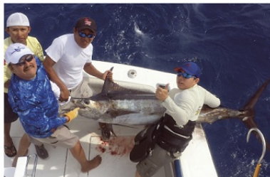
AQUÍ, LA LIBERACIÓN DEL MARLÍN AZUL en el V Torneo Internacional Fundadores Riviera Maya "Esteban Quian López".

Así mismo, de la pesca deportiva en Quin-