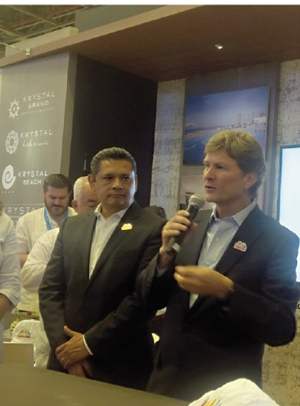
ENRIQUE DE LA MADRID CORDERO, secretario federal de Turismo.

Para ello, la OVC en coordinación con el Grupo Aeroportuario del Sureste (Asur), alista una campaña de promoción ligada a la venta de paquetes de viaje con el sector hotelero para apoyar el lanzamiento de la nueva ruta, que en los 90 fuera operada por vuelos charters y la aerolínea Taesa.