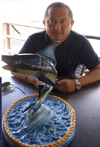
CATZÍN DIJO que el gusto por la pesca deportiva viene de familia.

tana Roo, mencionó "yo quiero felicitar a 'Pesca en el Caribe' y a todos los comités por-