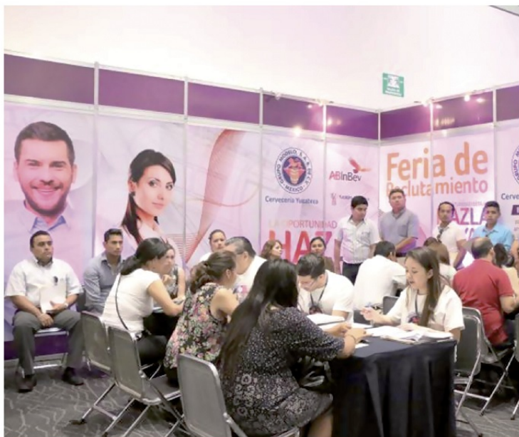
EL CENTRO DE CONVENCIONES Yucatán Siglo XXI fue sede de la feria de reclutamiento de la cervecera.

Hoy por hoy se tiene el 25% de avance de la planta con más de mil trabajadores, dicha planta ubicada en Hunucmá estará lista en el primer trimestre del 2017. La exportación de los productos de grupo Modelo, además de exportar la marca más valiosa que es la "Corona" serán exportados a E.U. a través