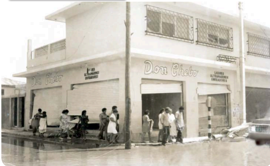
Vista de los daños ocasionados a un negocio comercial ubicado en la esquina de las arterias viales Carmen Ochoa de Merino y Juárez.

Empezando por la cultura anticiclónica arraigada entre los quintanarroenses que ha trascendido de generación en generación, difundir por todos los medios de comunicación social posibles a nivel estatal sobre qué hacer antes, durante y después de un huracán del inicio hasta el final de toda la temporada y no asumir que la mayoría de la ciudadanía ya cuenta con un teléfono inteligente, mantener en buen estado los albergues y los refugios para la población colocando de nueva cuenta la señalética para que la ciudadanía empiece a familiarizarse con ellos y los tenga plenamente identificados siempre.