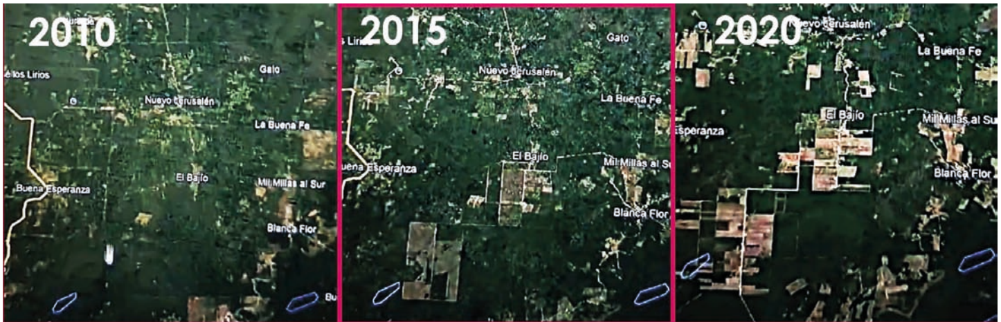
La devastación de selva en el Ejido El Bajío en 10 años por los menonitas.