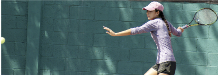
MIXCÓATL durante su entrenamiento en Playa del Carmen.