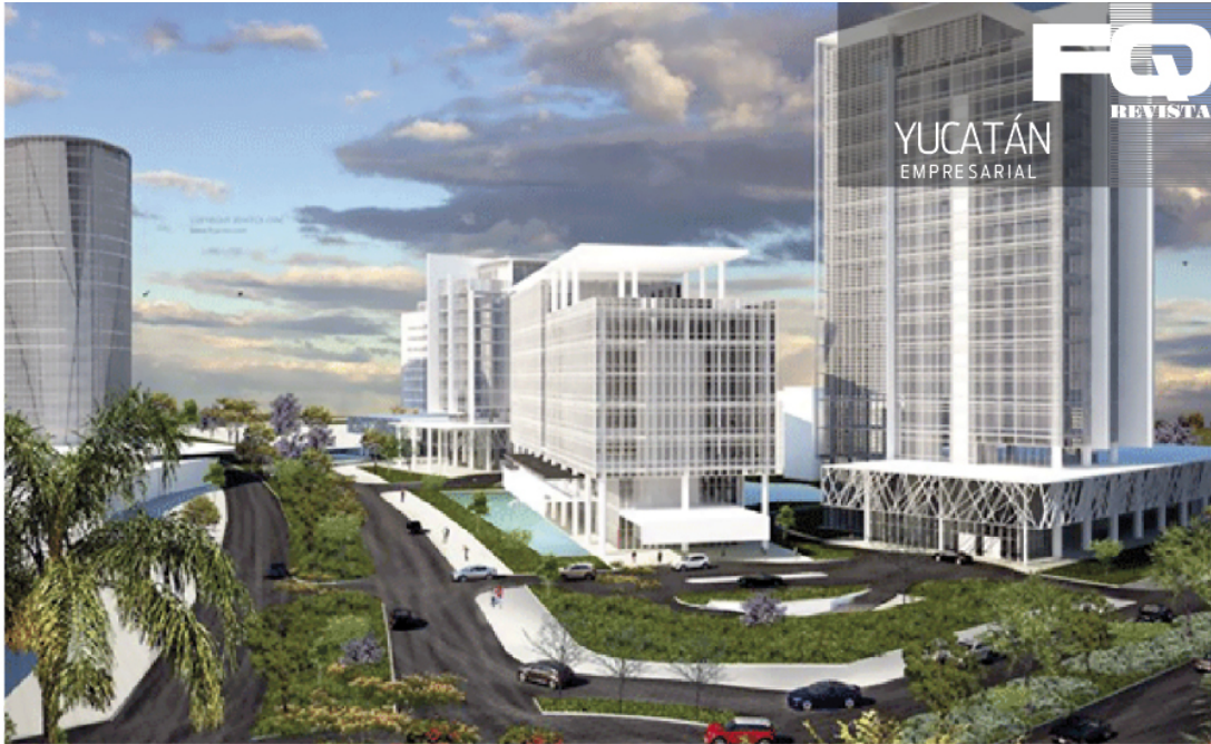
UNA MAQUETA de lo que será el megaproyecto inmobiliario.