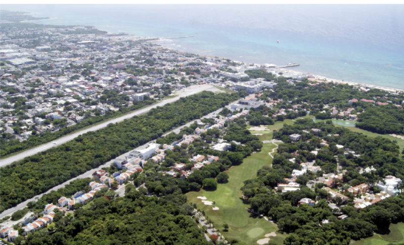
EL DESARROLLO debe ser equilibrado, sobre todo en infraestructura y servicios.

Este dato confirma su peso: de los siete aparentes aspirantes priistas a suceder al gobernador Roberto Borge Angulo en 2016, cuatro están relacionados con Solidaridad, donde tienen sus cuarteles generales, a su gente de confianza, a sus "operadores", como sue-