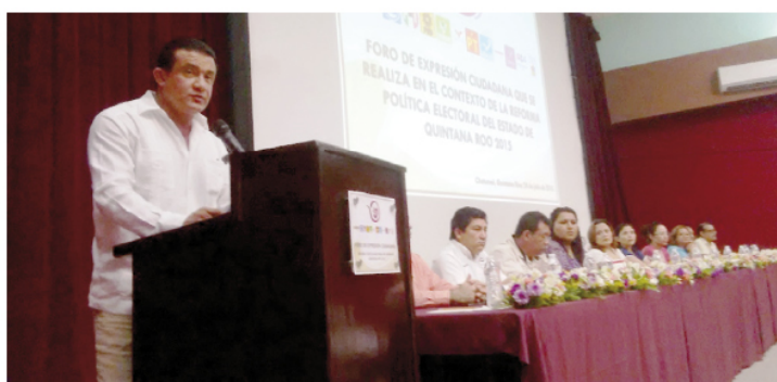
COMO PARTE DEL PROCESO, el IEQROO realizó dos foros de "expresión ciudadana".

La idea suena lógica: SI ALGÚN CIUDADANO QUIERE SER CANDIDATO "INDEPENDIENTE", no deberá ser militante de ningún partido en un periodo por determinar.