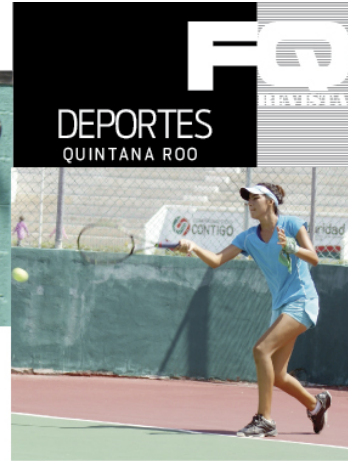
ITZÁ durante su entrenamiento en Playa del Carmen.