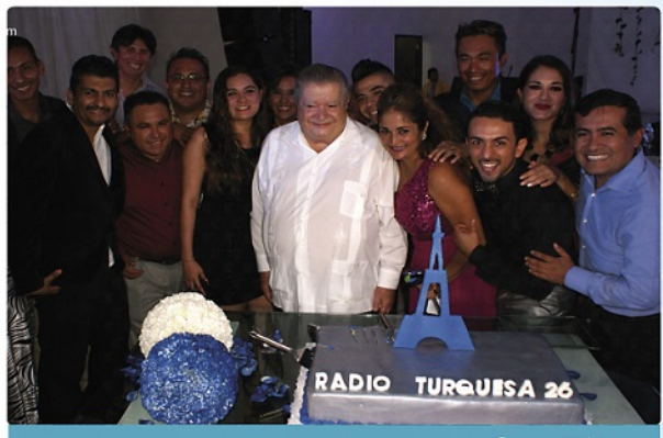
26 Aniversario Radio Turquesa