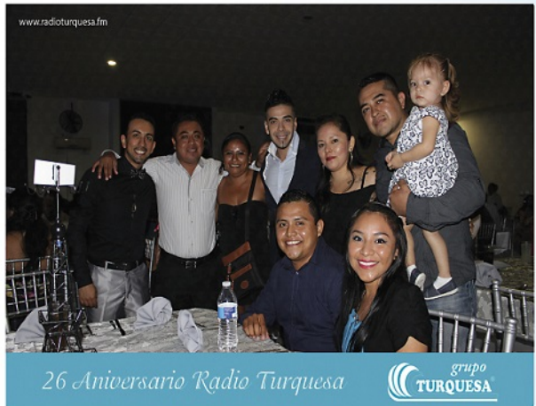
26 Aniversario Radio Turquesa