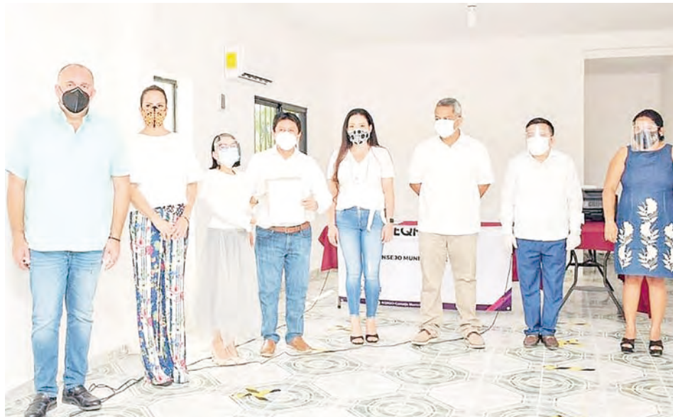
AL EVENTO asistieron habitantes de la zona maya para mostrar su apoyo al candidato.

No obstante que la convocatoria a la ciudadanía fue sólo para seguir el registro de manera virtual, al evento asistieron habitantes de la zona maya a manifestar su apoyo al ahora candidato, llegando personas desde Francisco Uh May, Ahumal, Chemuyil, entre otras.