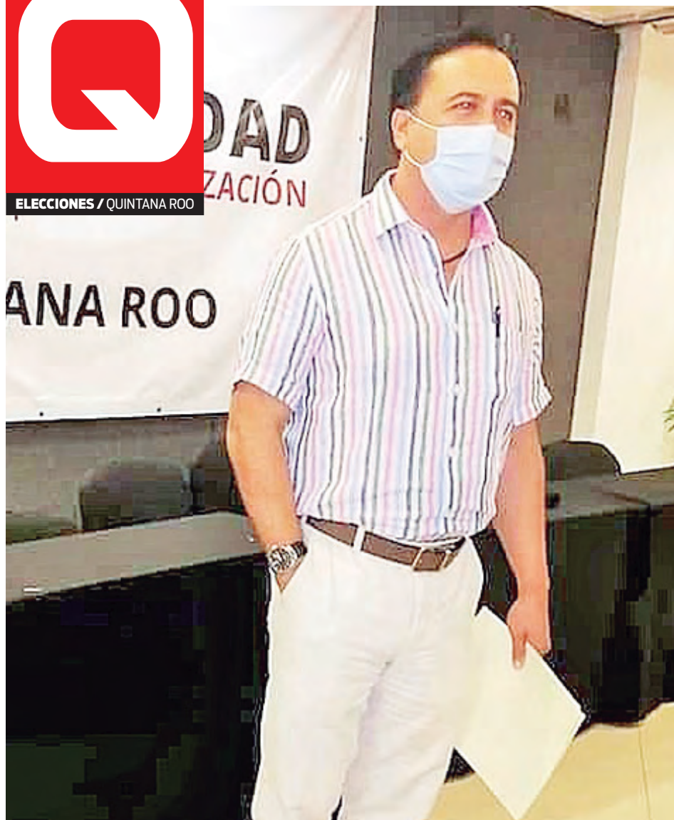
JORGE PARRA MOGUEL, secretario general del partido Movimiento Regeneración Nacional (MORENA).