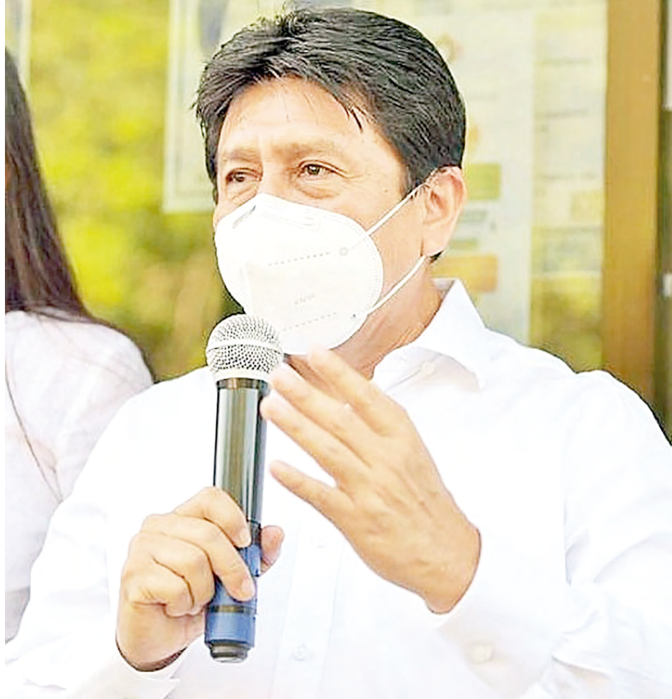
VICTOR MAS TAH, presidente municipal de Tulum.