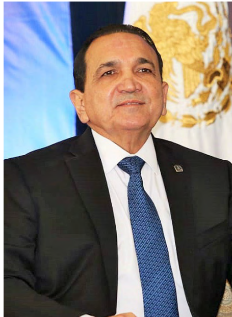
JOSÉ MANUEL LÓPEZ CAMPOS, presidente de la Concanaco.

Esta disposición, puntualizó, representa gran responsabilidad para las empresas y establecimientos, pues esta nueva reapertura no significa que el Coronavirus ya esté erradicado, sino que con el inicio de la vacunación, la estricta implementación de los protocolos sanitarios y medidas preventivas, se registra disminución de casos, lo que permitió a las autoridades aprobar la reapertura de